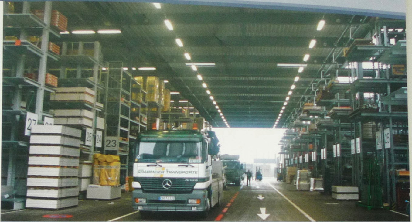
Das neue Baustoff-Logistik-Zentrum