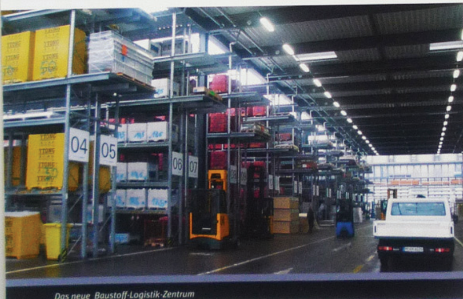
Das neue Baustoff-Logistik-Zentrum