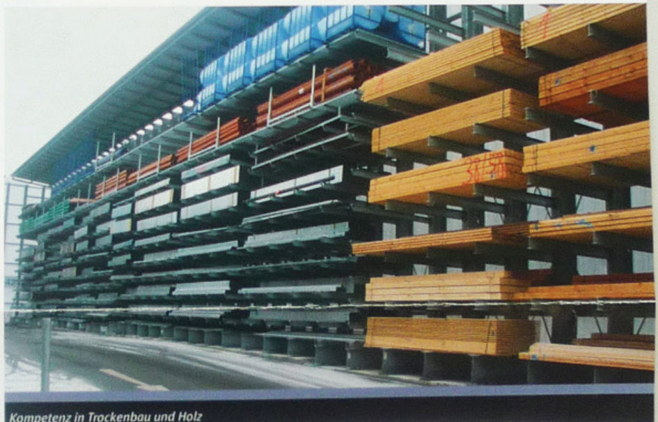
Kompetenz in Trockenbau und Holz